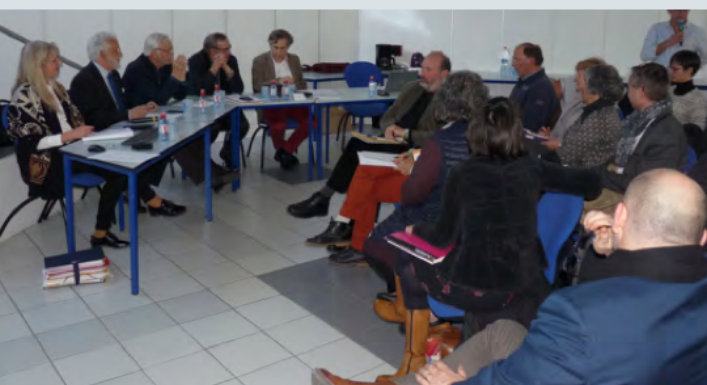
Assemblée générale du 26 mars 2018

À Saintes, le Conseil de développement est composé d'au maximum 45 membres, répartis en trois commissions de 15 membres. Il prend appui sur des groupes de travail, un bureau qui prend les décisions courantes et une assemblée plénière qui fixe les objectifs de travail annuels et valide les travaux.